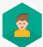
Kaspersky Safe Kids