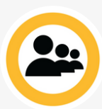
Norton Family Premier